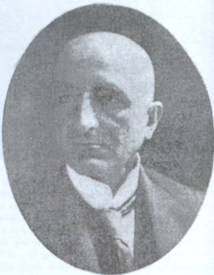
Երուանդ Օտեանը աքսորից յետոյ