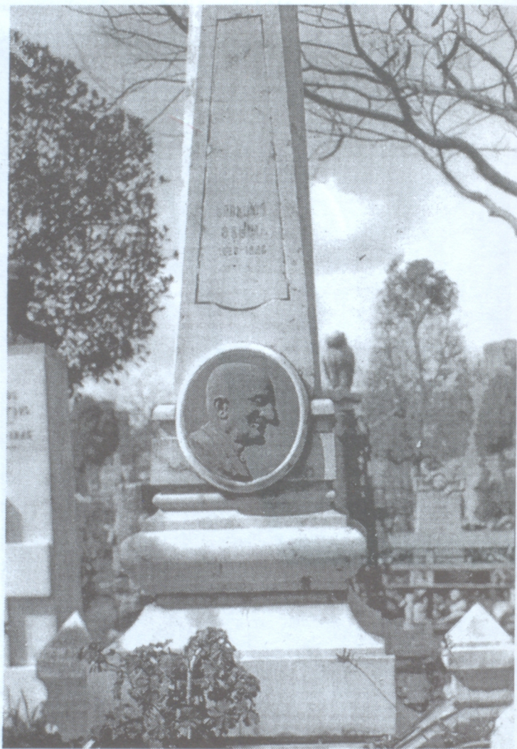
Երուանդ Օտեանի շիրիմը Կահիրեում

գամներ զիս քովը կանչած ու թարգմանութիւններ ընել տուած էր: Որոշեցի իսկոյն երթալ եւ իրմէ տեղեկութիւն ուզել: